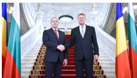
Președintele Republicii Bulgaria, domnul Rumen Radev și Președintele României, domnul Klaus Iohannis

Președintele României a declarat, între altele: