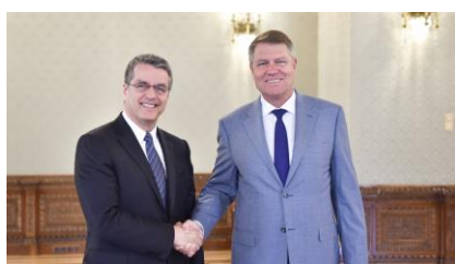
Directorului General al Organizației Mondiale a Comerțului (OMC), domnul Roberto Azevêdo și Președintele României, domnul Klaus Iohannis

Totodată, Președintele Klaus Iohannis a menționat faptul că orientarea către competitivitate necesită și o flexibilitate sporită, în special în sfera pieței muncii. În acest sens, se impune regândirea profundă a rolului sistemului educațional în dezvoltarea unei economii dinamice și inovative, prin care să fie valorificate