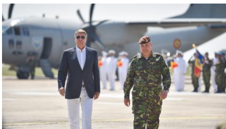
Președintele României, domnul Klaus Iohannis și Președintele Comitetului Militar al Alianței Nord-Atlantice, generalul Petr Pavel.

Președintele României a evidențiat implicarea națională substanțială în consolidarea posturii de descurajare și apărare a NATO în flancul estic, prin intermediul prezenței înaintate adaptate ( tailored Forward Presence ) în România și regiunea Mării Negre. (...)