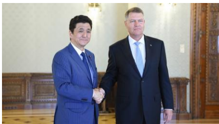
Ministrul de Stat pentru Afaceri Externe al Japoniei, domnul Nobuo Kishi și Președintele României, domnul Klaus Iohannis